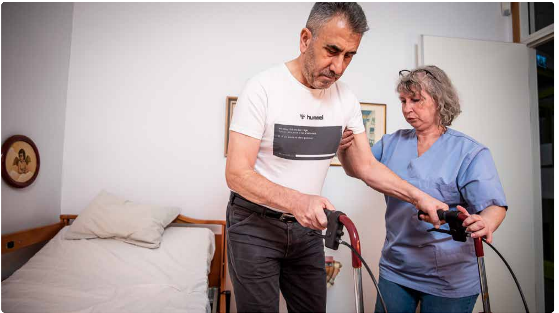
Från norr till söder, högerregeringens budget leder till nedskärningar i kommunerna.