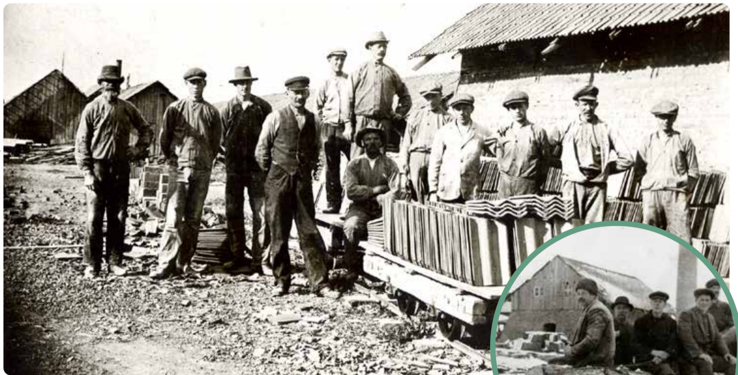
Vallentuna tegelbruk 1920.

FOTO OKÄND, VALLENTUNA BILDARKIV NR. 752