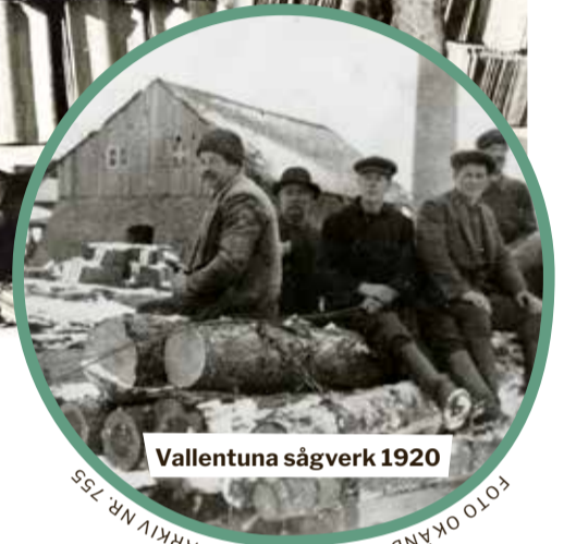
Vallentuna sågverk 1920