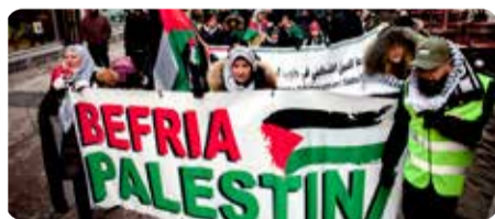
Palestinagrupperna syns på gator och torg.