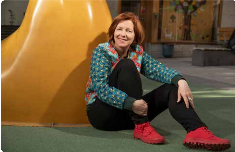
Malin Björk har suttit i EU-parlamentet i två mandatperioder.

– Det är den enda del i de nya lagförslagen som går ut på att öppna en dörr för människor på flykt, en säker väg. Det är jag stolt över att ha varit huvudansvarig för från parlamentets sida, säger Malin Björk.