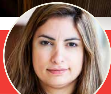
Nooshi Dadgostar partiledare (V)

Jonas Sjöstedt vill att politiken, inte marknaden, ska gå i täten för klimatet. Nu vill han ta plats i EU-parlamentet för Vänsterpartiet. sida 4